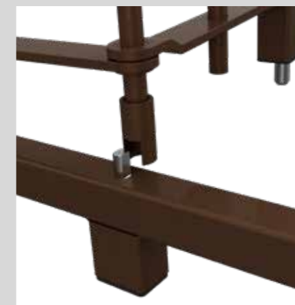
Particolare snodo Hinge detail