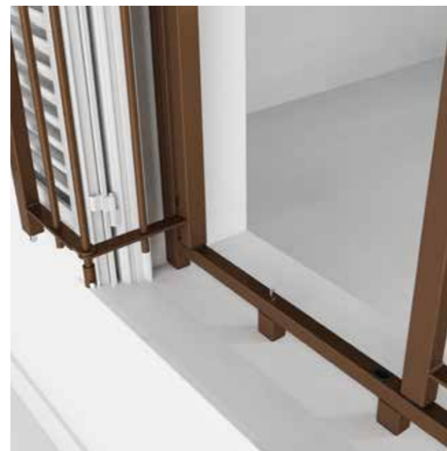
Posizione: Apertura totale esterna Position: Total external opening

La caratteristica della grata "Edilia 2" è la struttura resa semplificata. La grata è realizzata da un telaio perimetrale di acciaio zincato di sezione 30x30x2 mm di spessore. I telai perimetrali sono disponibili in 7 diverse tipologie, per offrire l'apertura più adatta alle proprie esigenze. La particolare conformazione della grata determina un ingombro complessivo di soli 35mm, permettendo l'applicazione anche in presenza di monoblocchi evitando modifiche ad infissi esistenti.