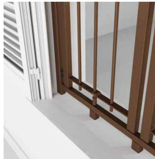
Posizione: Chiusa Position: Closed

The ACS 180 versions are equipped with a special articulated joint, which has a twofold function, in the opening stage, it overturns the panel completely towards the exterior, in the closing stage it locks itself with the frame through a carbonitrided steel pin and it also offers anti-rip out anchorage points. Thanks to its articulated joint allows obtaining a complete opening also towards the interior of the room, making opening window bolt of the shutter or large panel, easier.