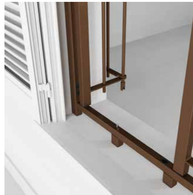
Posizione: Apertura totale interna Position: Total internal opening