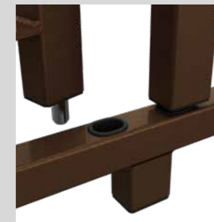
Puntale di chiusura superiore/inferiore Closure tip upper/lower