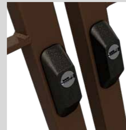
Defender esterno per cilindro passante External Defender for passing cylinder

The distinguishing feature of the "Edilia 2" security bar system is its streamlined structure. The security bar system consists of a perimeter frame in galvanized steel with a 30x30 mm section and 2 mm thick. The perimeter frames are available in 7 different versions to offer the most suitable opening for your needs. Its particular structure leads to an overall size of just 35mm, allowing its use even in presence of mono-blocks with no need to make changes to existing windows.