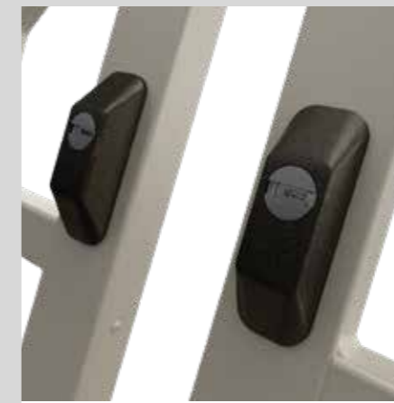
Defender esterno per cilindro passante External Defender for passing cylinder

"Sikura" the first and only security bar system with articulated joint certified as Class 4. The security bar system consists of a perimeter frame in galvanized steel with a 20x30 mm section and 2 mm thick. The perimeter frames are available in 7 different versions to offer the most suitable opening for your needs. The hinges are manufactured in steel using a micro-casting process; its particular structure leads to an overall security bar size of just 35mm, allowing its use even in presence of mono-blocks with no need to make changes to existing windows. Each security bar is equipped with two compensation profiles, U shaped and with 20x35x20 size, suitable to correct any out of square of the vertical sides. The wall mounting of the frame is ensured by dowels and it does not need any masonry.