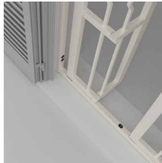
Posizione: Apertura totale interna Position: Total internal opening