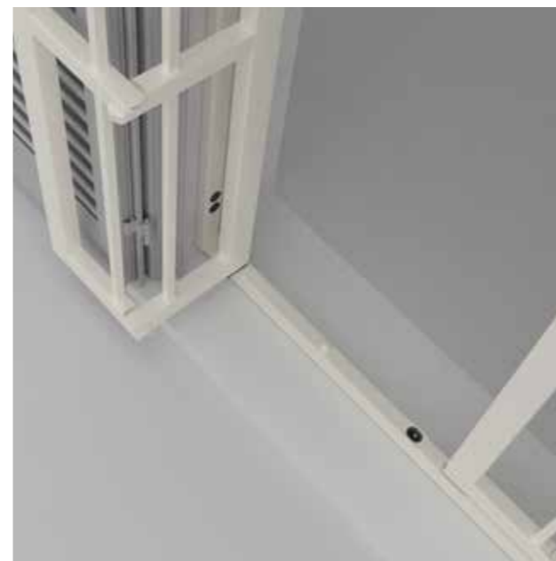
Posizione: Apertura totale esterna Position: Total external opening

"Sikura" è la prima grata di sicurezza con snodo certificata in classe 4. La grata è realizzata da un telaio perimetrale di acciaio zincato di sezione 20x30x2 mm di spessore. I telai perimetrali sono disponibili in 7 diverse tipologie, per offrire l'apertura più adatta alle proprie esigenze. Le cerniere sono costituite in acciaio tramite processo di microfusione, la particolare conformazione della stessa determina un ingombro complessivo della grata di soli 35mm, permettendo l'applicazione anche in presenza di monoblocchi evitando modifiche ad infissi esistenti. Ogni grata è dotata di 2 profili di compensazione ad U (20x35x20) adatti a correggere eventuali fuori squadra nei lati verticali. Il fissaggio a parete del telaio è garantito tramite tasselli e non necessita di nessuna opera muraria.