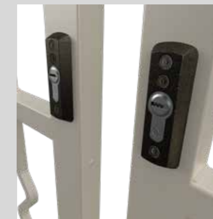
Mezzo cilindro Half cylinder