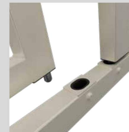
Puntale di chiusura superiore / inferiore Closure tip upper lower