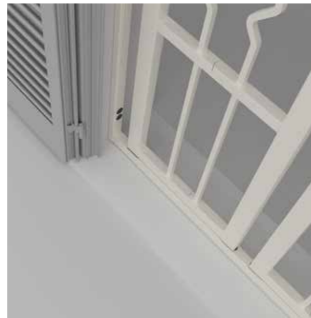
Posizione: Chiusa Position: Closed

The ACS 180 versions are equipped with a special articulated joint, which has a twofold function, in the opening stage, it overturns the panel completely towards the exterior, in the closing stage it locks itself with the frame through a steel pin and it also offers anti-rip out anchorage points. Thanks to its articulated joint allows obtaining a complete opening also towards the interior of the room, making opening window bolt of the shutter or large panel, easier.